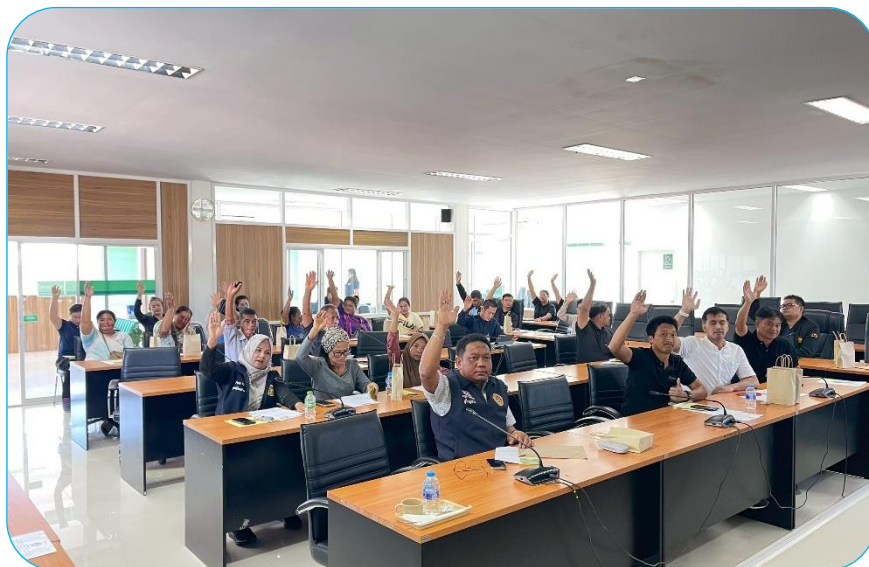
ผู้เข้าร่วมประชุมยกมือเห็นด้วยกับโครงการฯ ที่จะก่อสร้าง