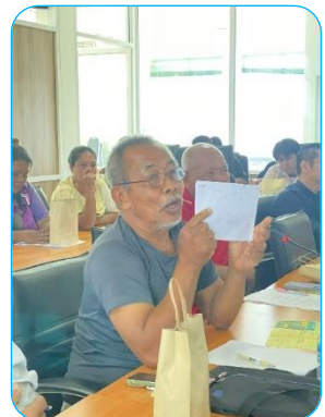
ผู้เข้าร่วมประชุม ชักถาม – เสนอแนะความคิดเห็น