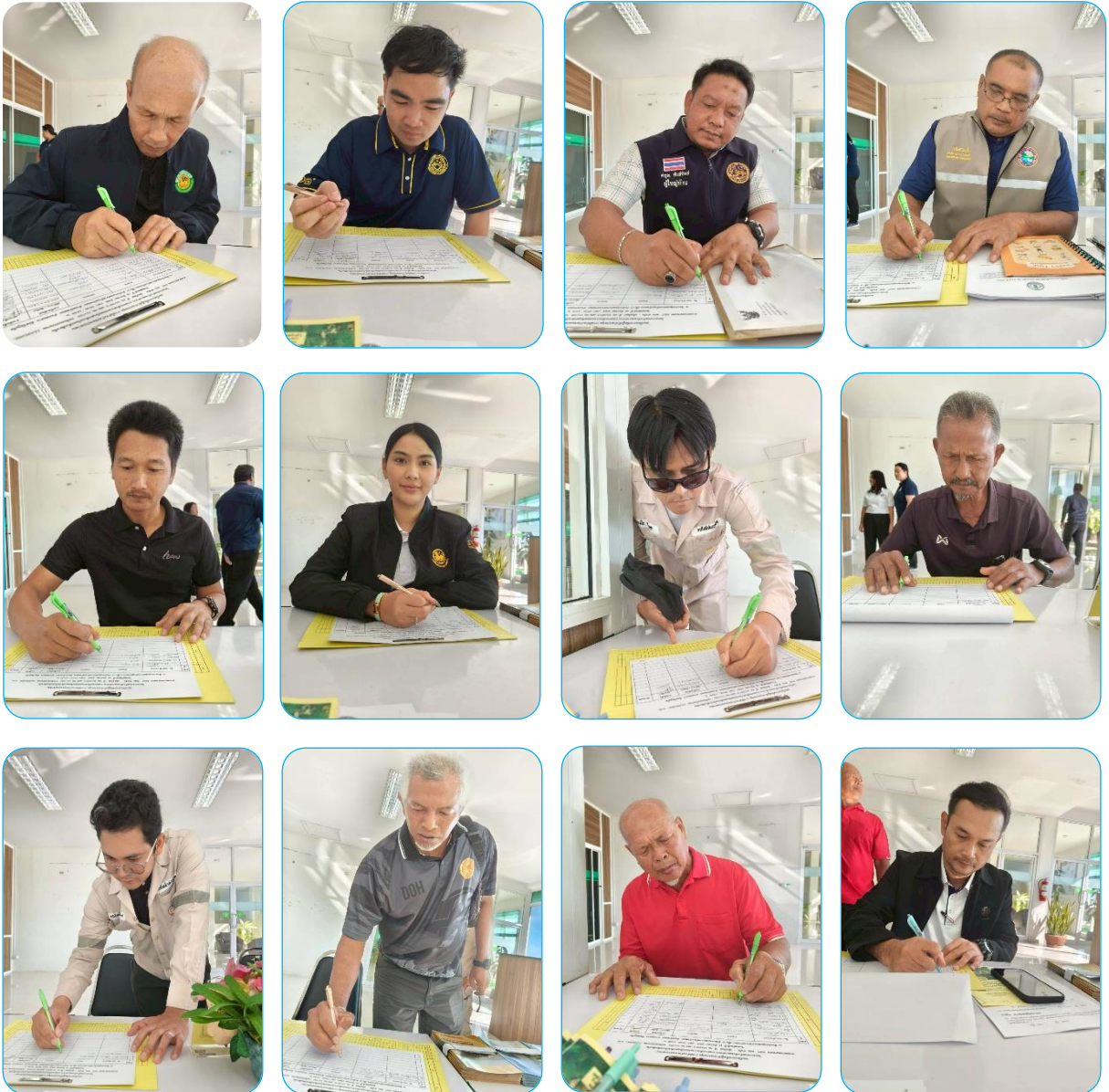
ผู้เข้าร่วมประชุม ลงทะเบียน รับเอกสาร