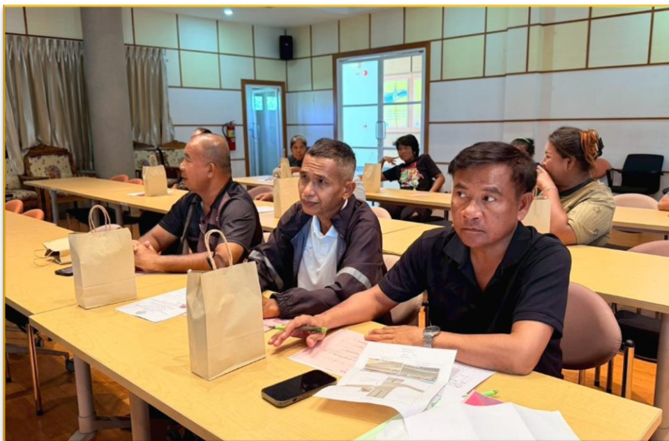
ผู้เข้าร่วมการประชุม รับฟังการบรรยายรายละเอียดโครงการฯ