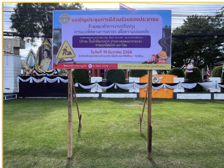
ดำเนินการติดตั้งป้ายประชาสัมพันธ์จำนวน ๑ แห่ง