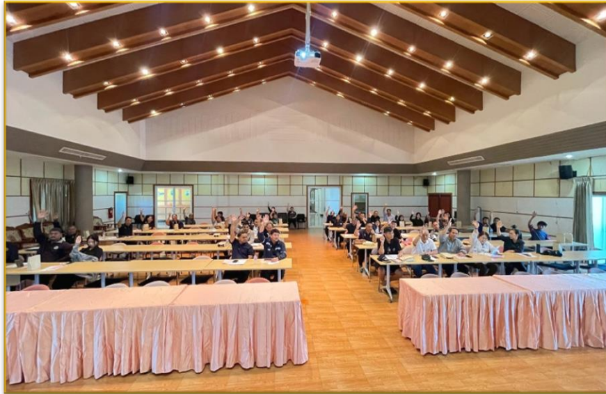
ผู้เข้าร่วมประชุมยกมือเห็นด้วยกับโครงการฯ ที่จะก่อสร้าง