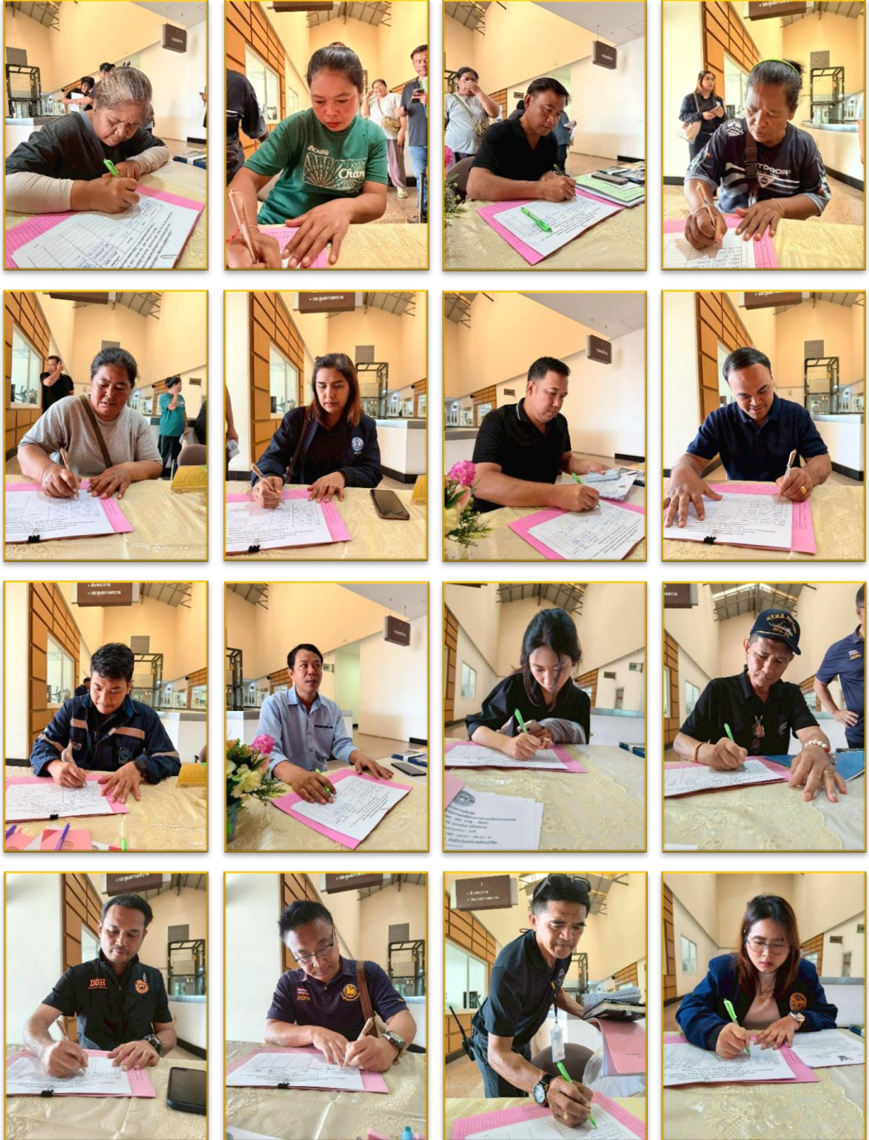
ผู้เข้าร่วมประชุม ลงทะเบียน รับเอกสาร