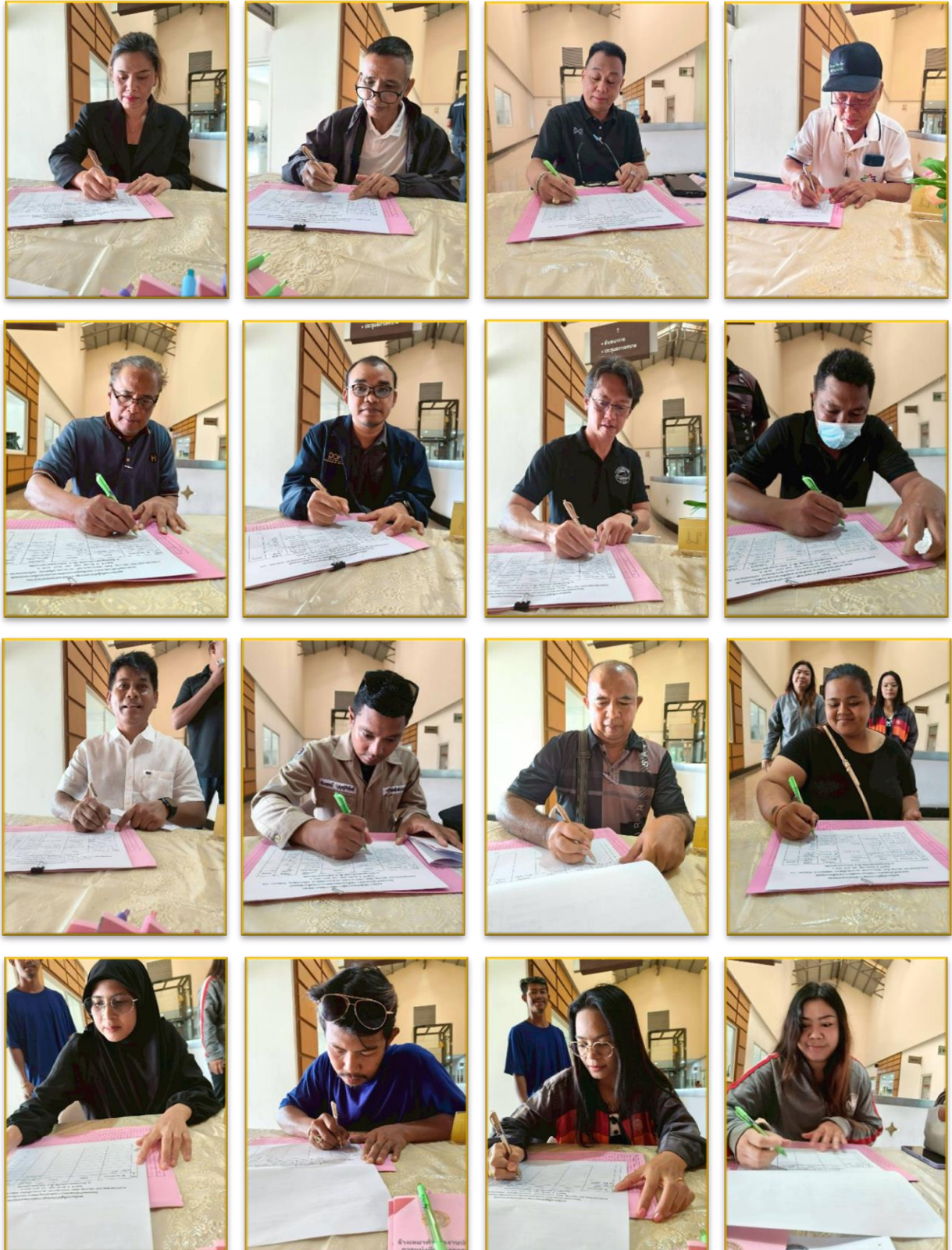
ผู้เข้าร่วมประชุม ลงทะเบียน รับเอกสาร