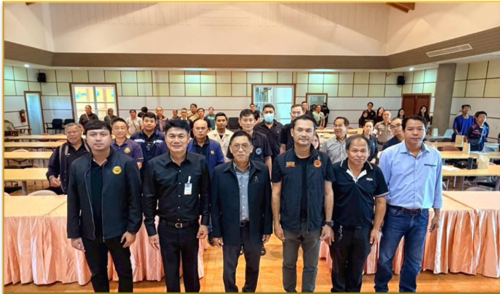
ประธาน ผู้นำท้องถิ่น ผู้นำชุมชน วิทยากร ผู้บริหารแขวงทางหลวงภูเก็ต และผู้เข้าร่วมประชุม