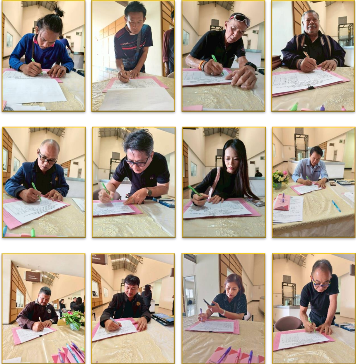
ผู้เข้าร่วมประชุม ลงทะเบียน รับเอกสาร