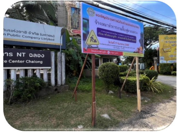
ดำเนินการติดตั้งป้ายประชาสัมพันธ์ จำนวน ๑ แห่ง