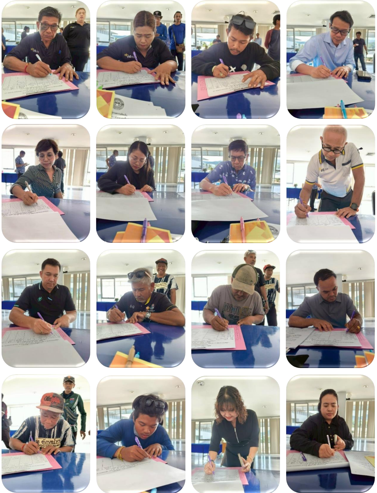
ผู้เข้าร่วมประชุม ลงทะเบียน รับเอกสาร