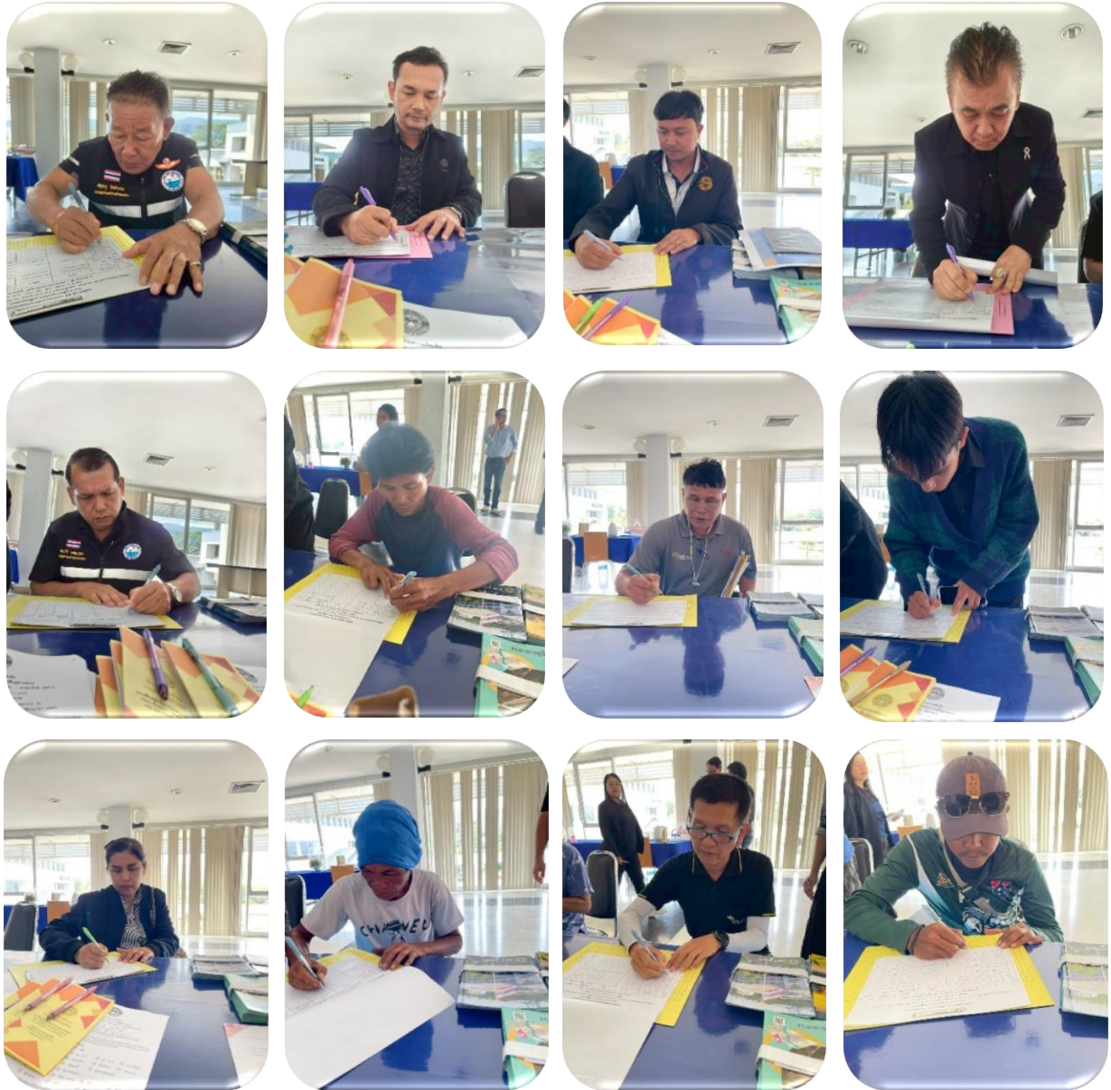
ผู้เข้าร่วมประชุม ลงทะเบียน รับเอกสาร