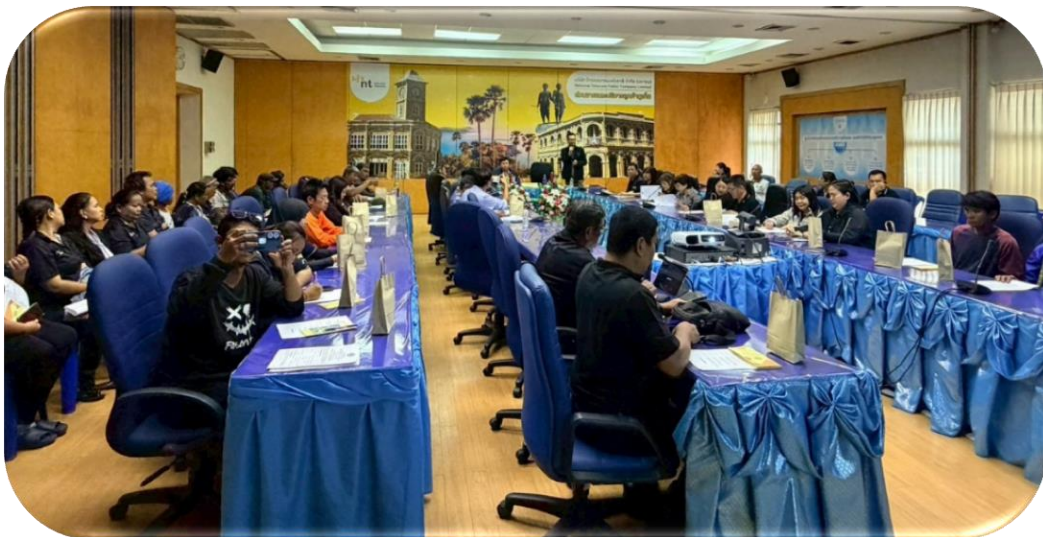
ผู้เข้าร่วมการประชุม รับฟังการบรรยายรายละเอียดโครงการฯ