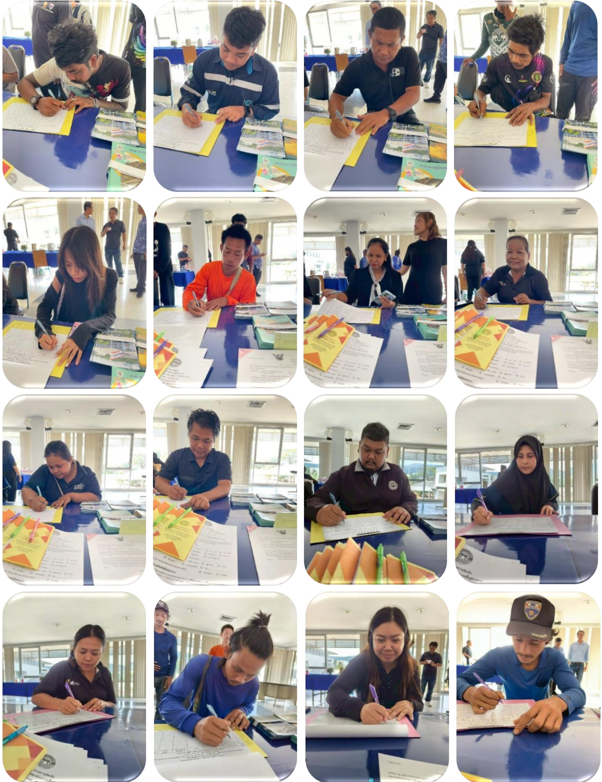
ผู้เข้าร่วมประชุม ลงทะเบียน รับเอกสาร