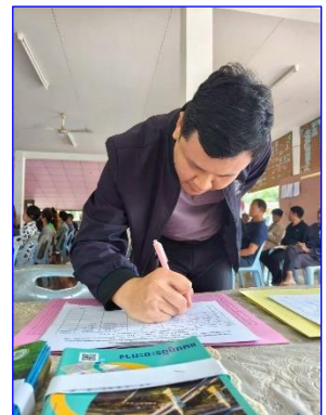
ผู้เข้าร่วมประชุม ลงทะเบียน รับเอกสาร