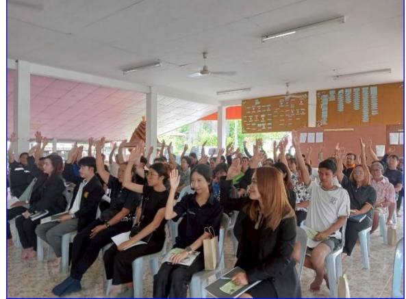
ผู้เข้าร่วมประชุมยกมือเห็นด้วยกับโครงการฯ ที่จะก่อสร้าง