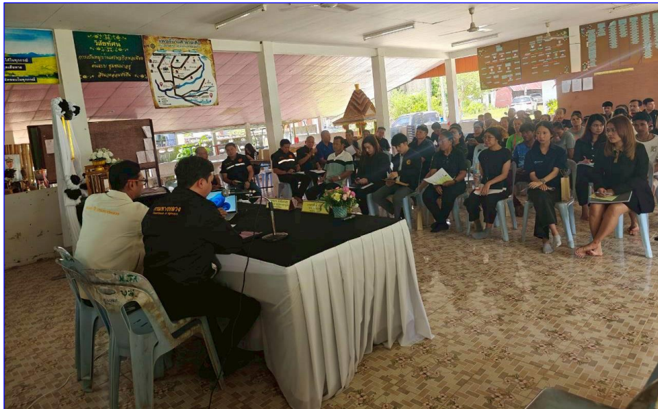
ผู้เข้าร่วมการประชุม รับฟังการบรรยายรายละเอียดโครงการฯ