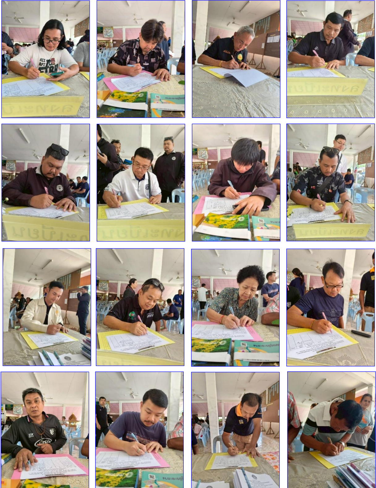
ผู้เข้าร่วมประชุม ลงทะเบียน รับเอกสาร