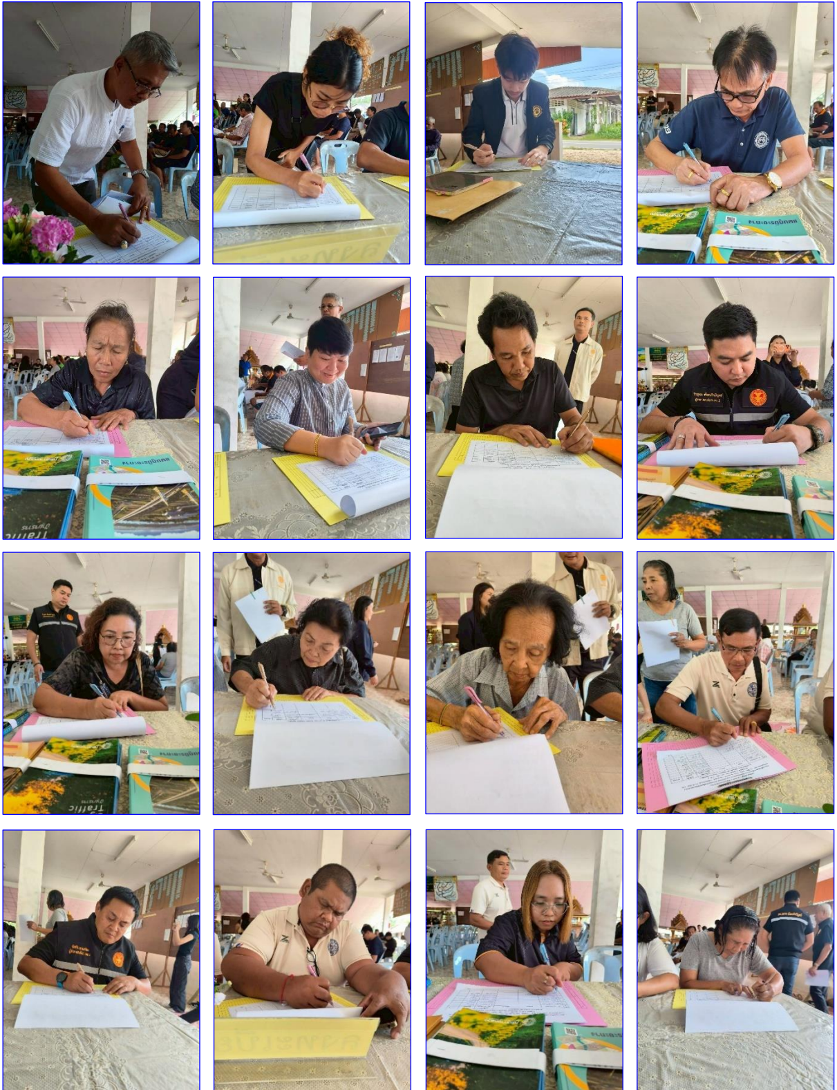
ผู้เข้าร่วมประชุม ลงทะเบียน รับเอกสาร