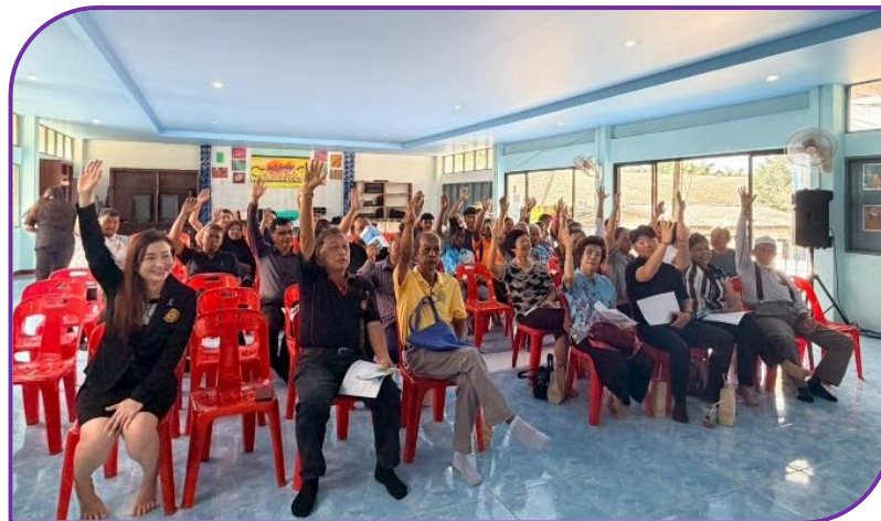
ผู้เข้าร่วมประชุมยกมือเห็นด้วยกับโครงการฯ ที่จะก่อสร้าง