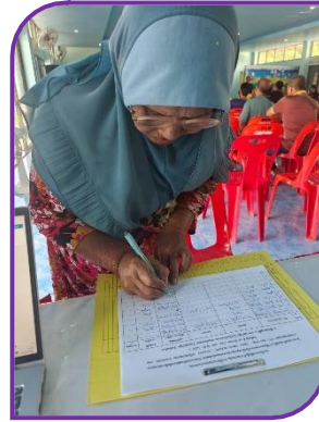
ผู้เข้าร่วมประชุม ลงทะเบียน รับเอกสาร