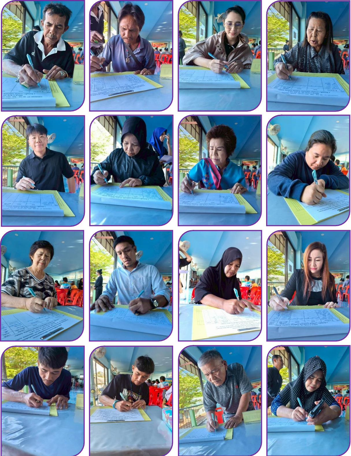
ผู้เข้าร่วมประชุม ลงทะเบียน รับเอกสาร