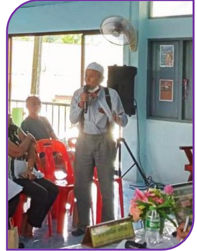
ผู้เข้าร่วมประชุม ชักถาม - เสนอแนะความคิดเห็น