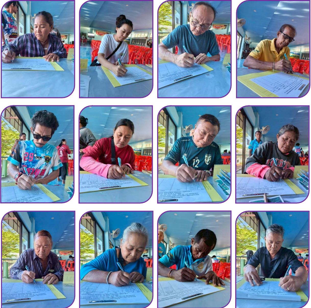
ผู้เข้าร่วมประชุม ลงทะเบียน รับเอกสาร