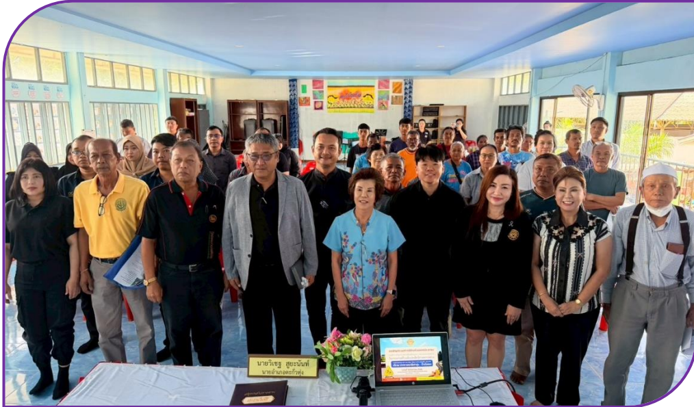
ประธาน ผู้นำท้องถิ่น ผู้นำชุมชน วิทยากร ผู้บริหารแขวงทางหลวงภูเก็ต และผู้เข้าร่วมประชุม ร่วมถ่ายภาพ